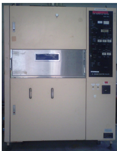
スーパーUVテスター