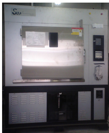
サンシャインウェザーメーター