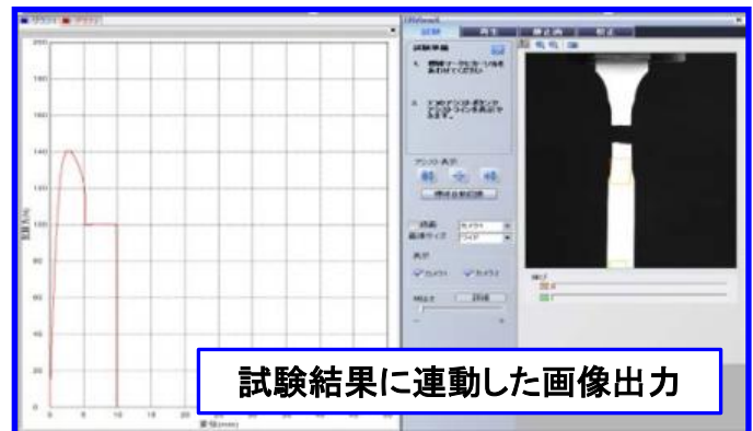
試験結果に連動した画像出力